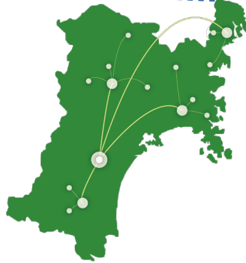
大きな宮城県のマークが目印