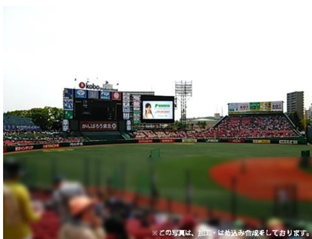
※この写真は、加工・はめ込み合成しております。