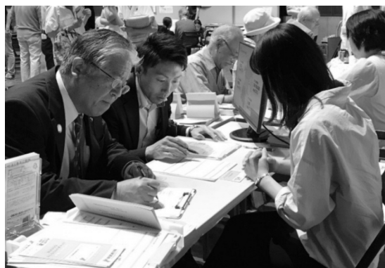
加入申込書にご記入中の登米市熊谷市長