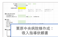
栗原中央病院様作成： 吸入指導依頼書